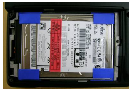
Für maximalen Schutz ist die Festplatte mit Gummistreifen umgeben. Das ist ein wichtiger Bestandteil des Toshiba Shock Protection Designs.,

Neben dem LCD ist die Festplatte eine weitere unerlässliche Komponente des Notebooks, da hierauf sämtliche Daten gespeichert sind, die bis zum jeweiligen Zeitpunkt generiert wurden. Um Datenverlust und Probleme beim Hochfahren (oder Starten), die sich durch physische Einwirkung ergeben können, vorzubeugen, ist die Festplatte in Notebooks an allen vier Kanten mit zusätzlichem stoßdämpfendem Material versehen, das bei Stößen als zusätzliches Puffer dient und die Festplatte besser schützt.