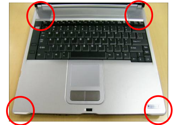
Weit hinaus gezogene Kanten, ein wichtiger Bestandteil des Toshiba Shock Protection Design-Konzepts, bieten mehr Raum für die Stoßdämpfung

Die abgerundeten Kanten bilden die zweite Schutzebene. Sie bieten, im Gegensatz zu nicht abgerundeten Kanten, ein höheres Maß an Stoßdämpfung. Weit hinausgezogene Kanten sind die letzte Ebene, die vor Stößen schützt. Die überstehenden Kanten bieten zusätzlichen Raum, der als Puffer zwischen den Komponenten und dem Gehäuse des Notebooks dient und so maximalen Schutz bietet.